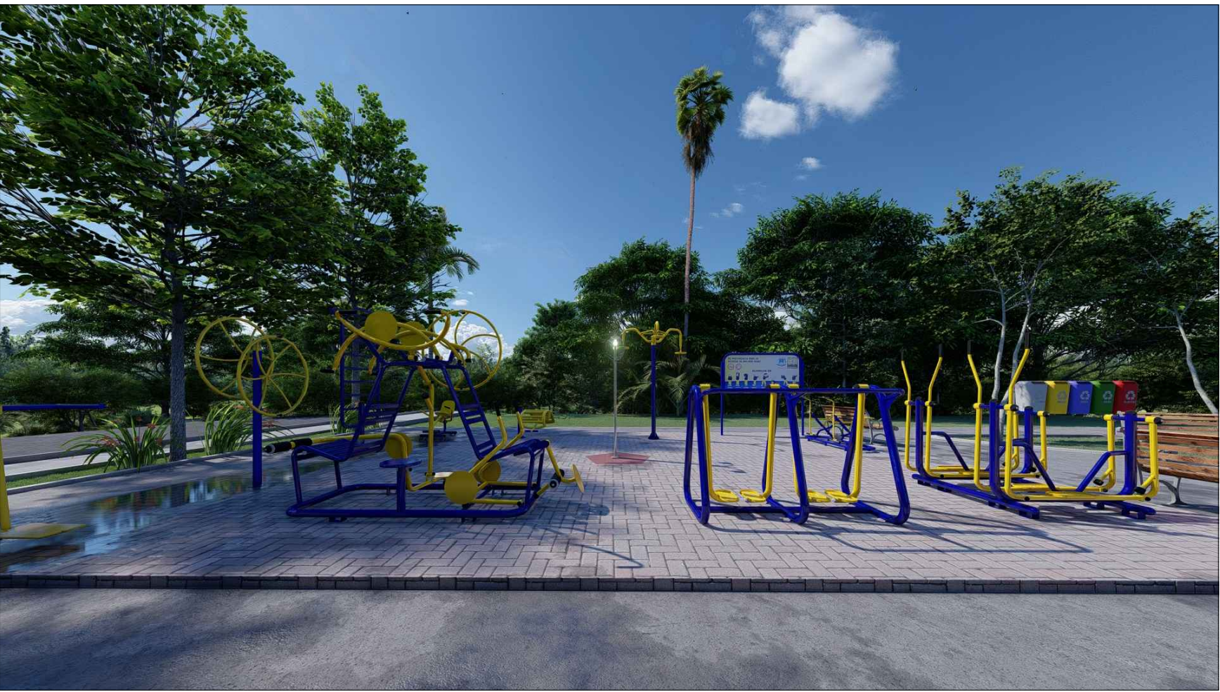
PERSPECTIVA 3D - 05 ESC: SEM ESCALA