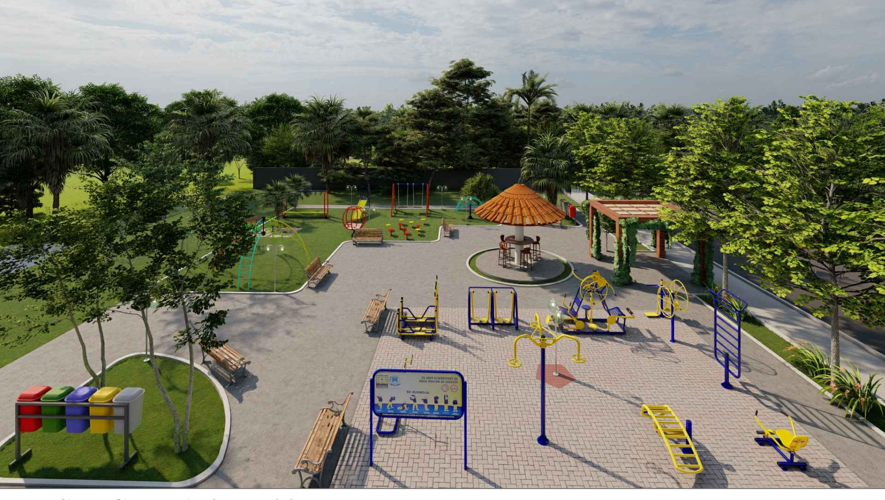
PERSPECTIVA 3D - 03 ESC: SEM ESCALA