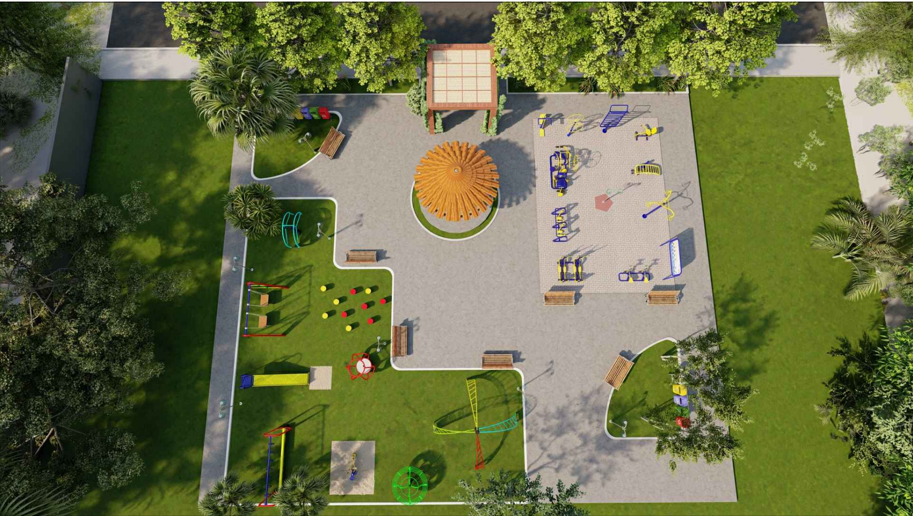
PERSPECTIVA 3D - 01 ESC: SEM ESCALA