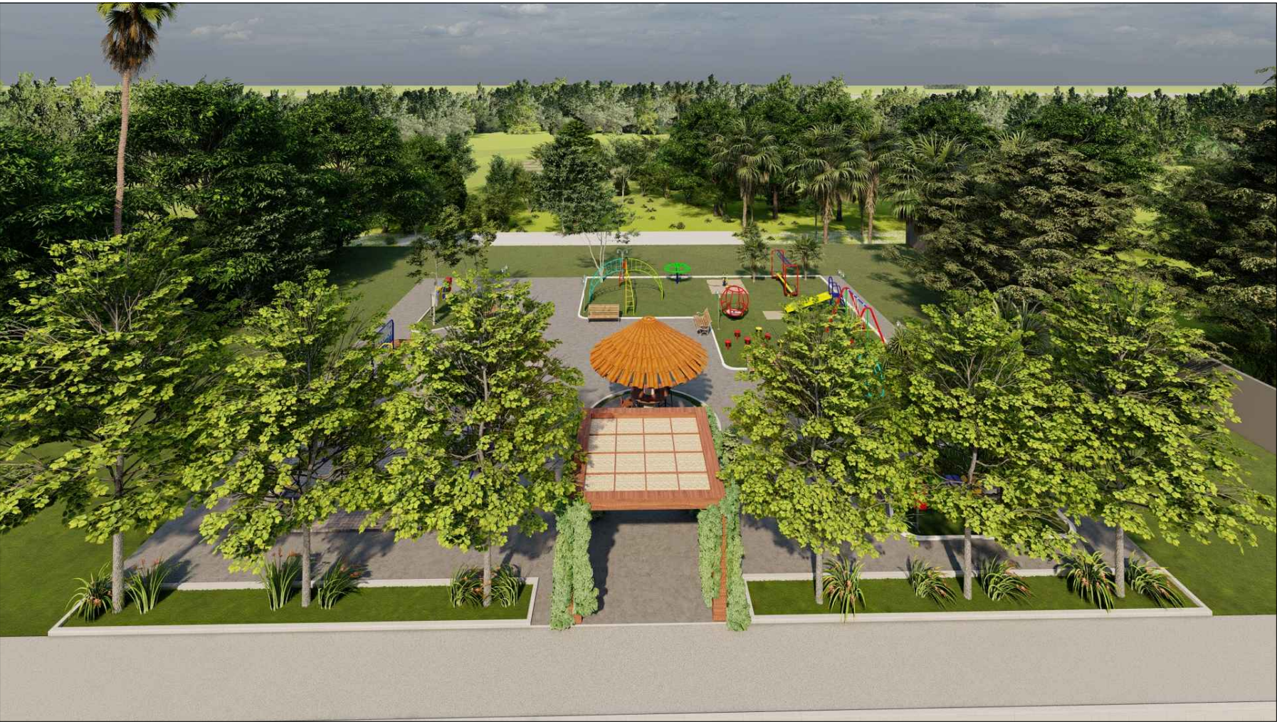
PERSPECTIVA 3D - 02 ESC: SEM ESCALA