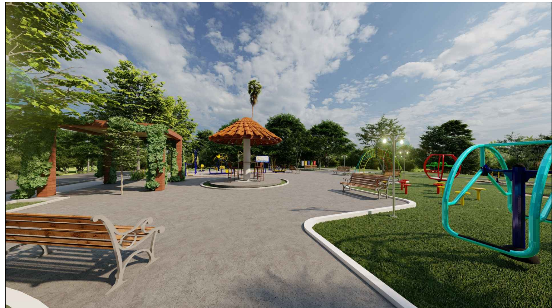
PERSPECTIVA 3D - 06 ESC: SEM ESCALA