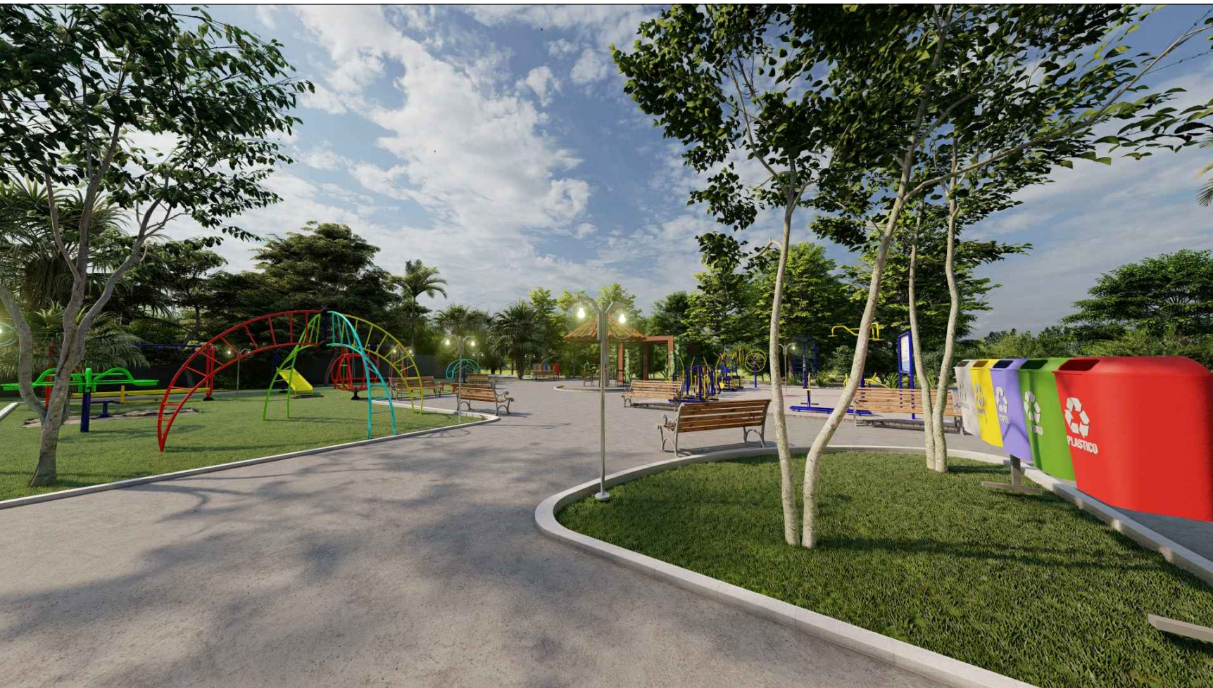
PERSPECTIVA 3D - 07 ESC: SEM ESCALA