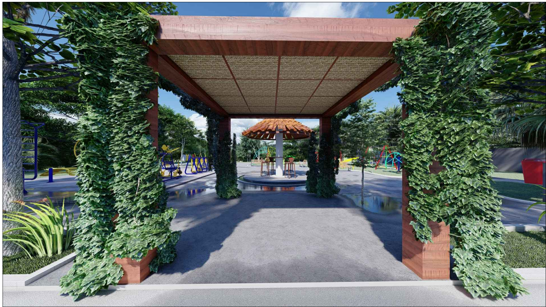
PERSPECTIVA 3D - 04 ESC: SEM ESCALA